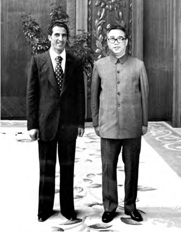
كيم إيل سونغ وعبد السلام جلود أثناء زيارته لكوريا الشمالية.